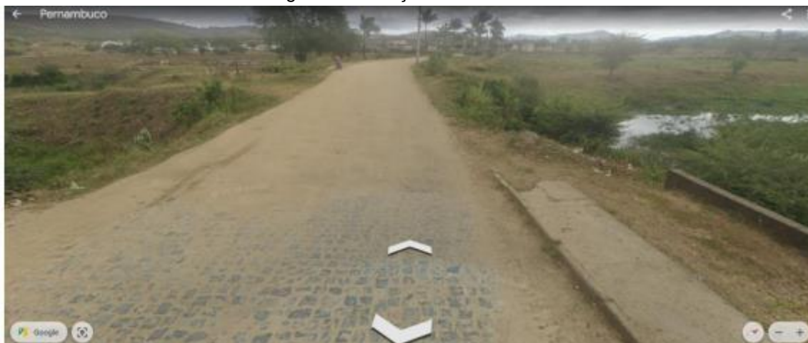
Figura 2 - Situação Atual da Área