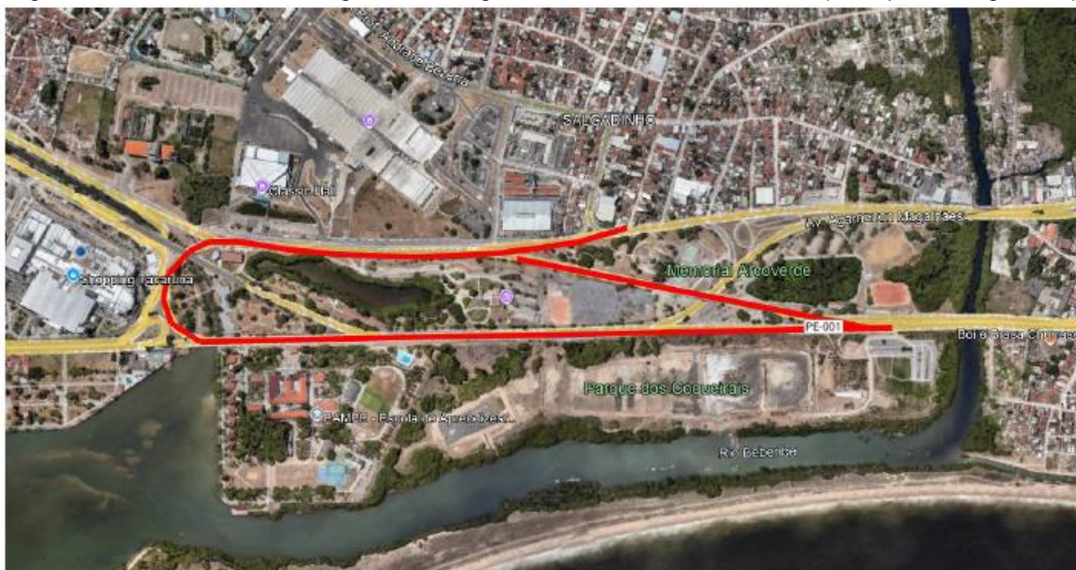
Figura 3: Trecho da Av. Gov. Agamenon Magalhães e Trecho da Av. Olinda ( Complexo Salgadinho)