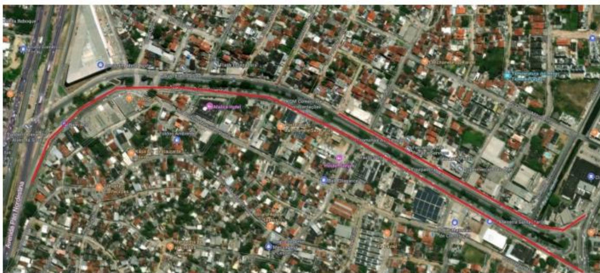
Figura 2: Av. Chico Science