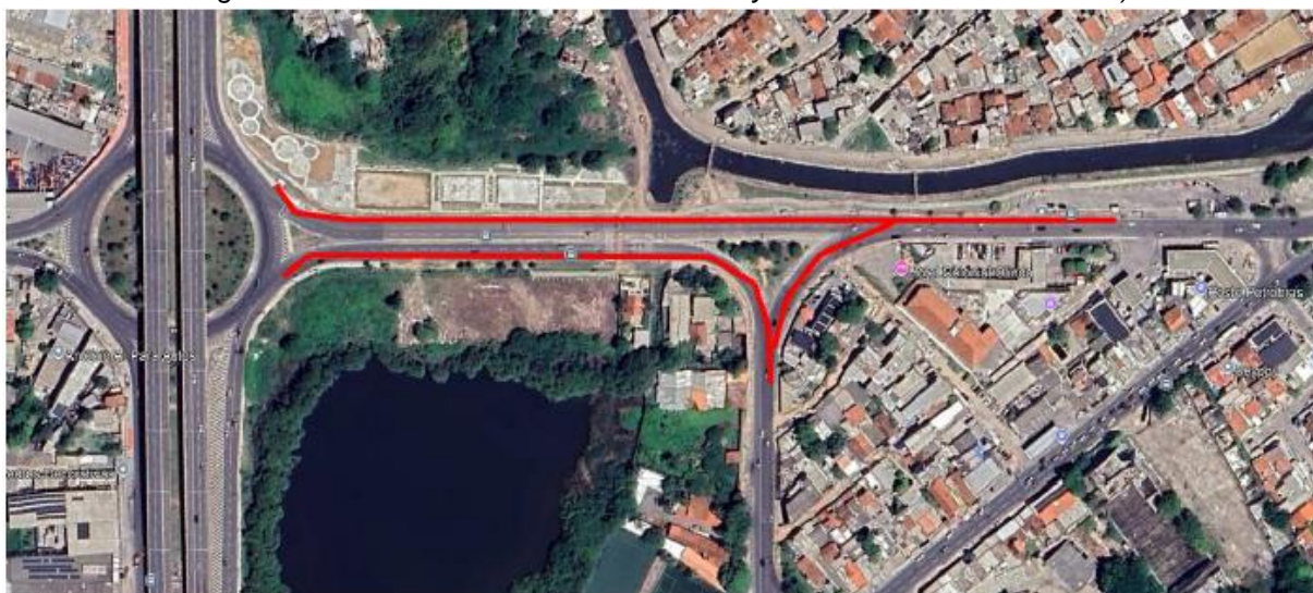
Figura 1: Trecho da Av. Presidente Kennedy e Trecho da Travessa Piza)