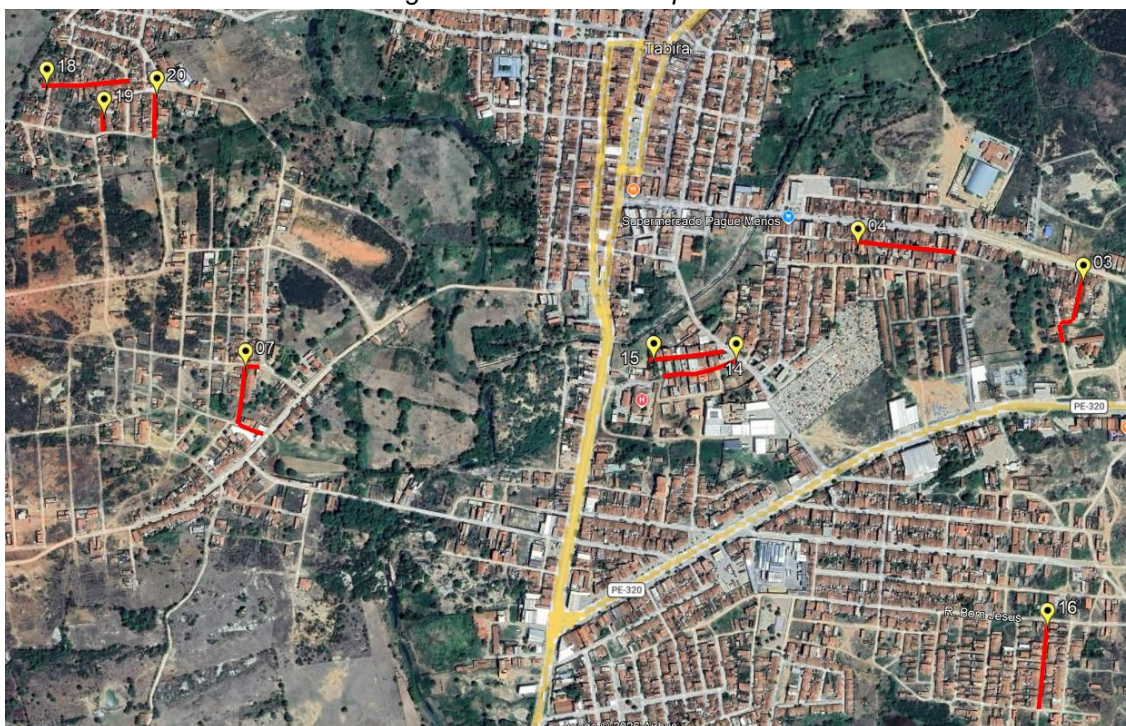
Figura 02 – Vias contempladas.