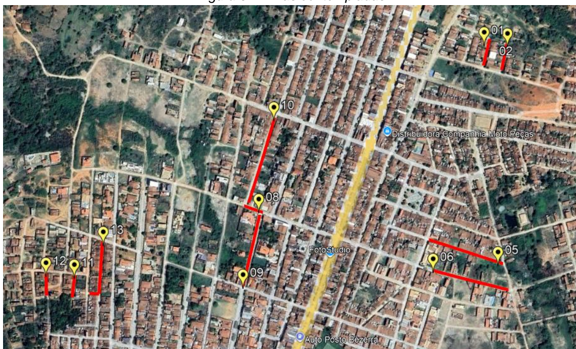
Figura 01 – Vias contempladas.