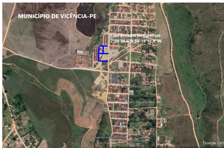
Figura 2: Imagem de Satélite da Área