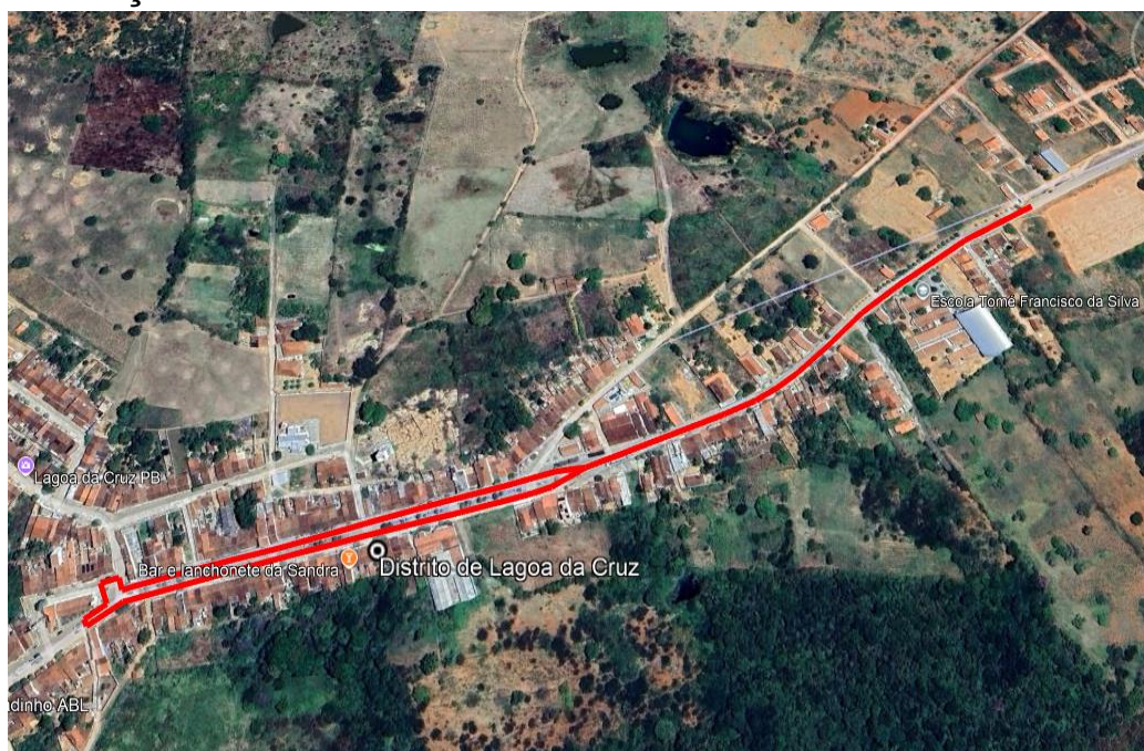
Figura 1 – Rua Tomás Francisco da Silva no Distrito de Lagoa da Cruz