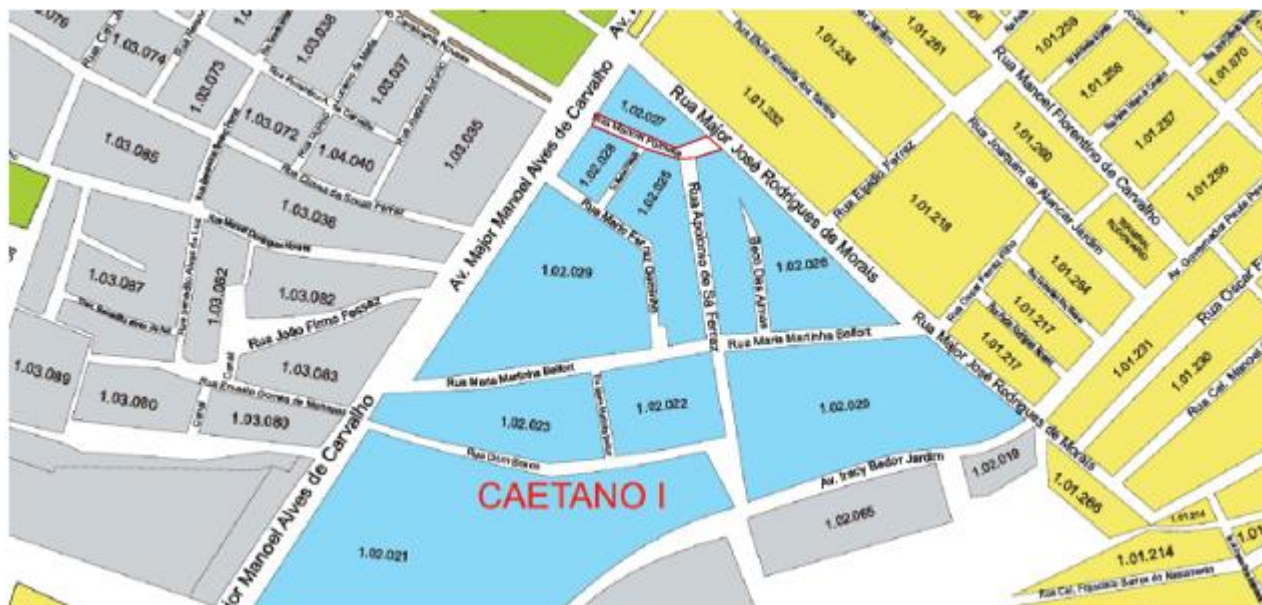
Figura 4 - Rua Manoel Polmata

As ruas a serem contempladas nesta contratação são: