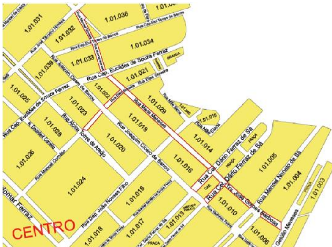
Figura 2 – Ruas Maria Menezes, XV de Novembro, Travessa José Gomes Barbosa