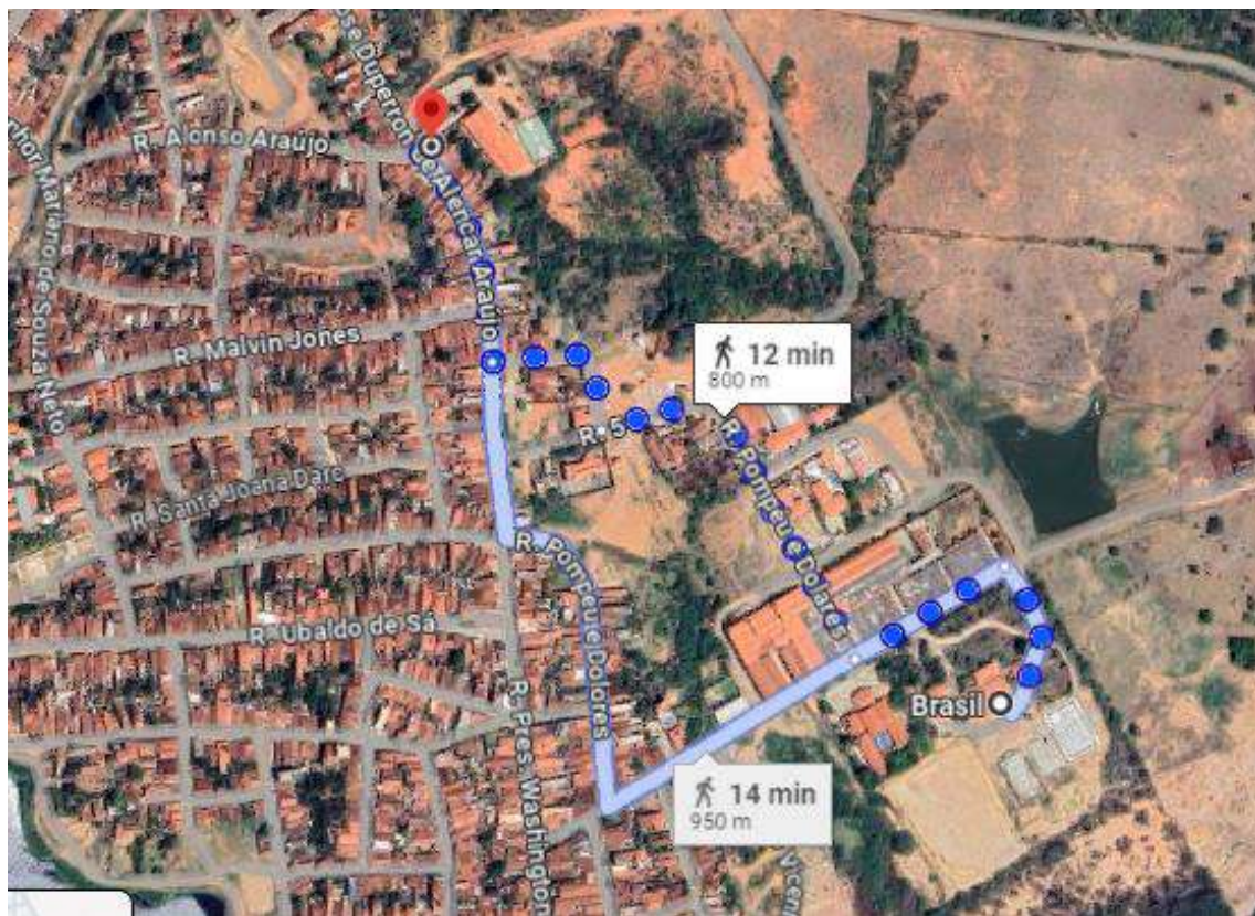
Escola Municipal Valdemar Soares de Menezes – Ensino Fundamental I e II

Qualificação superior: Existência prévia de acesso a pelo menos 2 (dois) equipamentos públicos de educação relacionados acima.