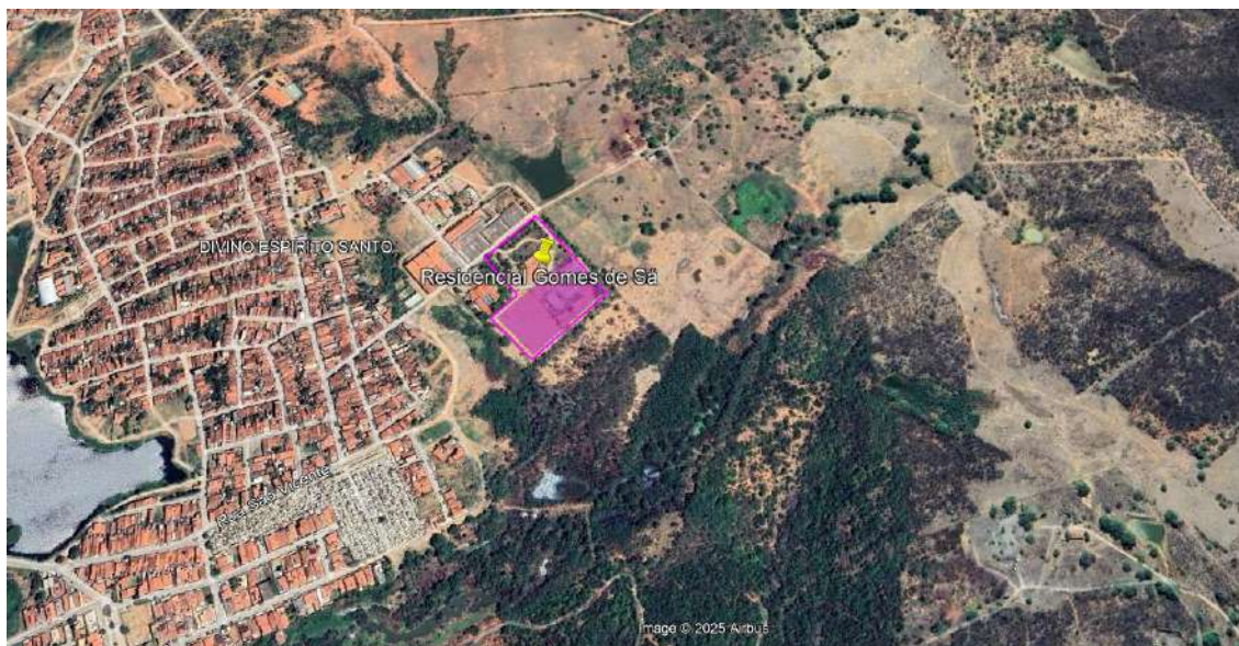
Em rosa, poligonal sugerida para implantação do habitacional.

Qualificação superior: Localização em área urbana consolidada.