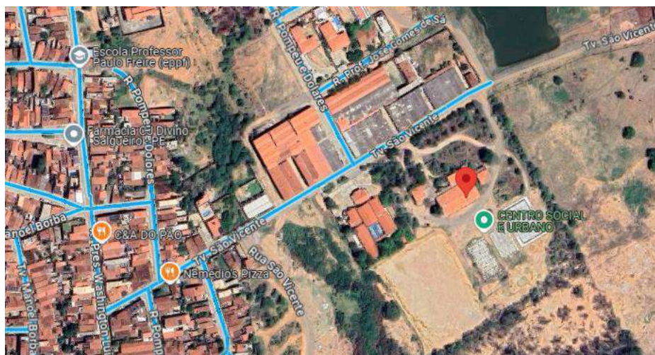
Pavimentação de ruas no entorno do terreno.