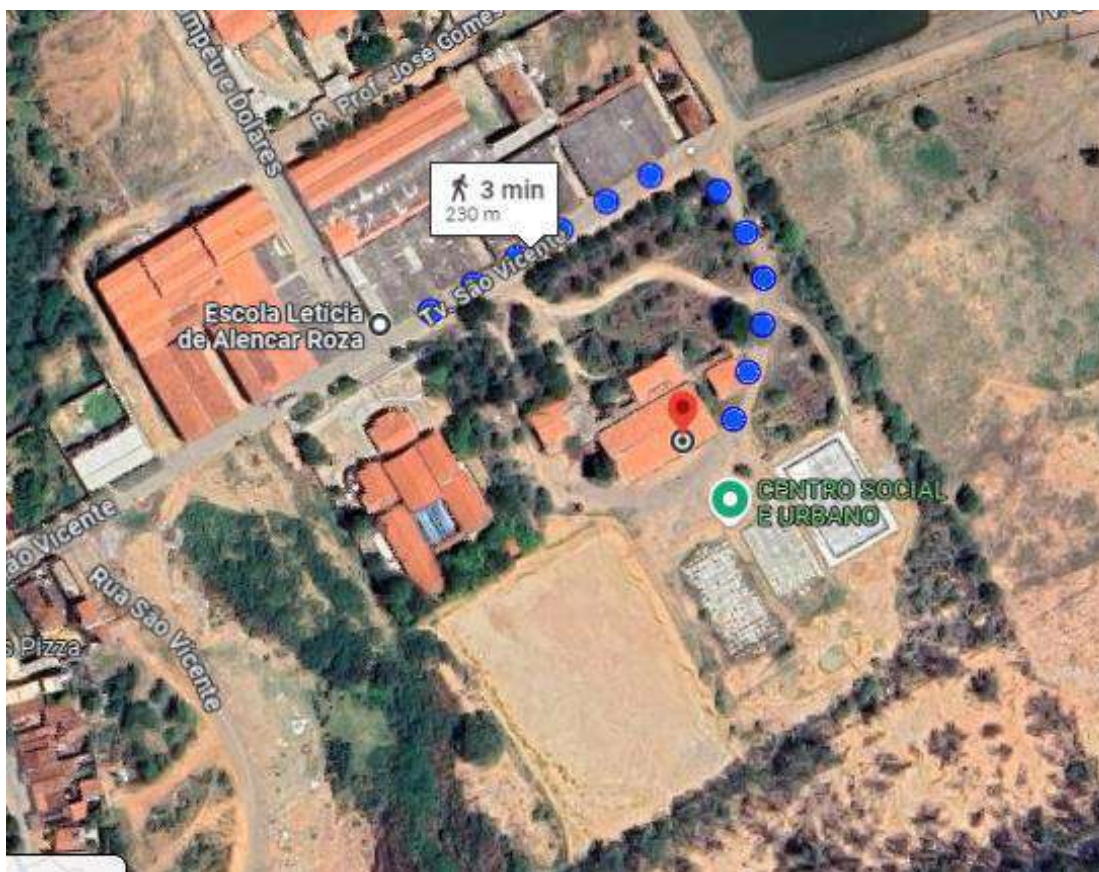
Escola Letícia de Alencar Roza e Dantas- Ensino Infantil