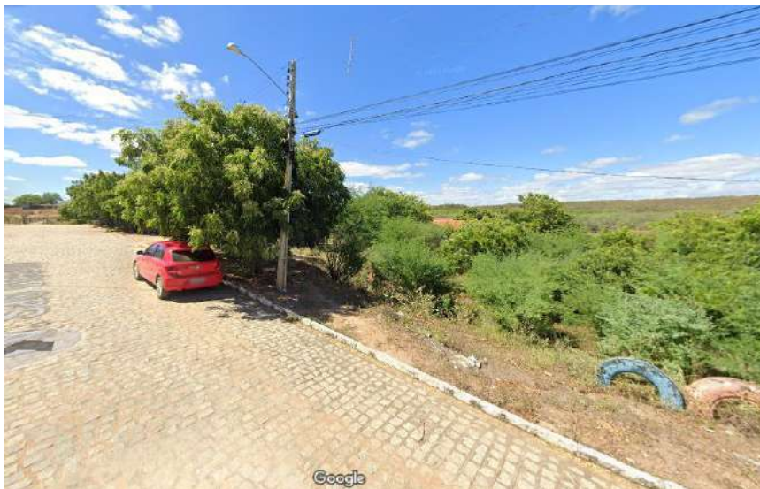
Rua com rede de energia elétrica, coleta de lixo, pavimentada e com água potável.

Qualificação superior: Existência prévia de ao menos 4 (quatro) sistemas de infraestrutura urbana relacionados acima.