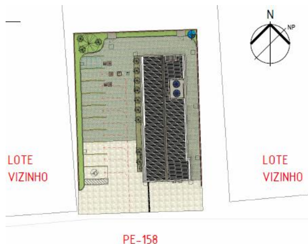
Panelas: Planta de Situação – sem escala.

2.8. No município de Panelas , a edificação será implantada em um terreno com área de 1.017,00 m 2 e contará com unidade-padrão tipo 1B, casa de bombas e área para estacionamento privativo: